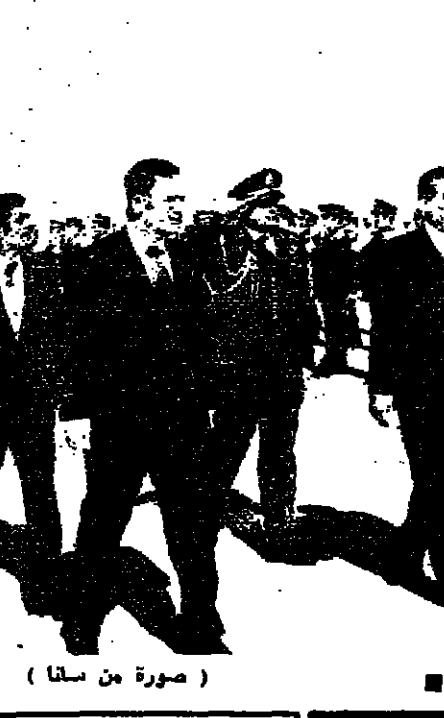
الرئيسان يستعرضان حرس الشرف في مطار دمشق ( صورة من سانا )